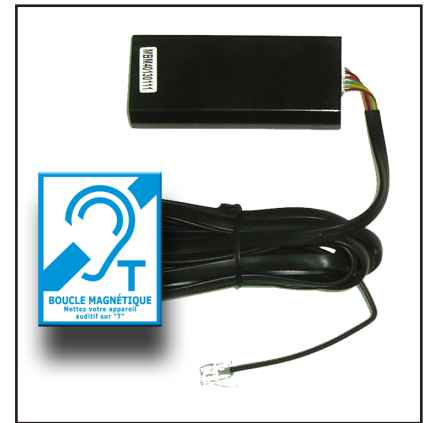
Contenu du pack

Fonctionne avec ANEP BOX TA / TA+ / TX / TX+